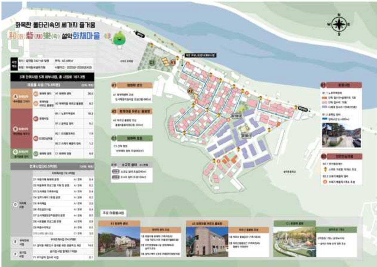
[그림 1] 설악동 화채마을 계획안