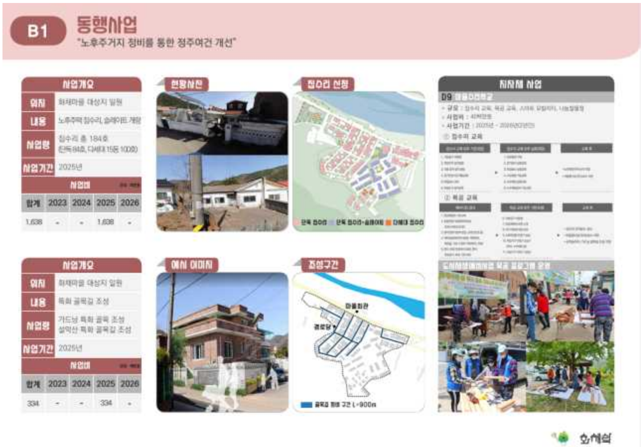
[그림 3] 화재마을 노후주거지 정비사업 세부계획