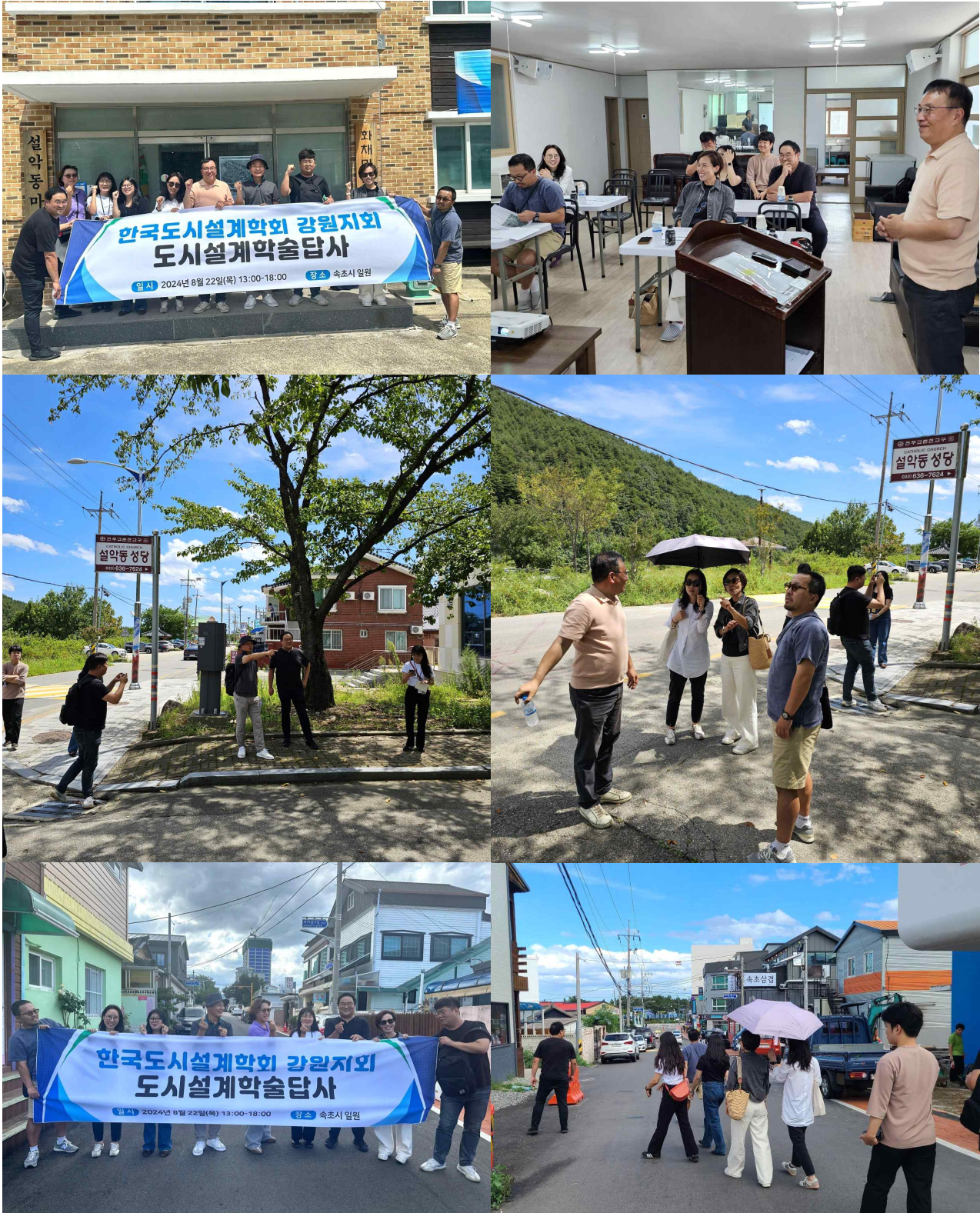
[그림 6] 학술답사 현장사진